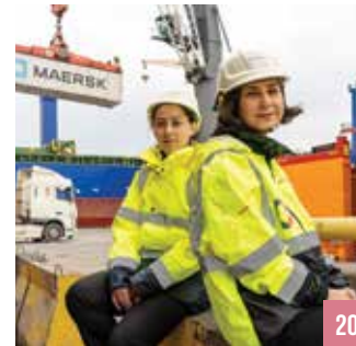
ქალბი საზღვაო ინდუსტრიაში