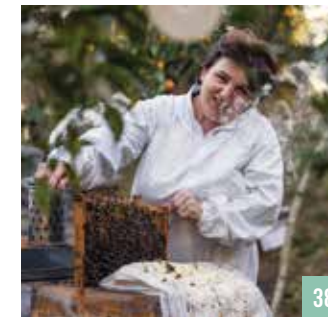
როგორ გავიზრდეთ გურული „თაფლოვანი“