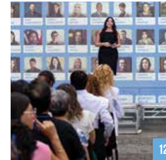
„სოსარი გრეინი“ – შთაბრძნა, როგორც დროს უძლავს