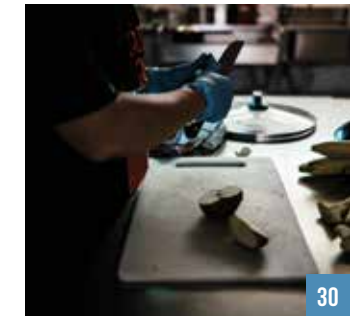
თქვენ ეხმარებით ქალბს, როგორც საზღვაო გაემხმან