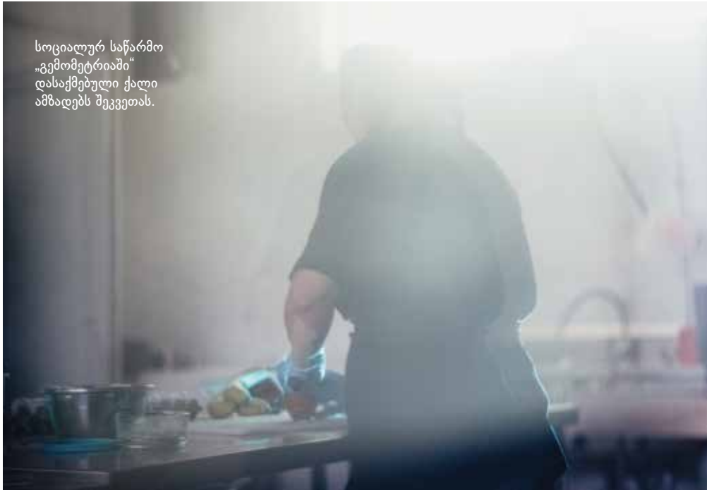
სოციალურ საწარმო „გემომეტრიის“ დასაქმებული ქალი ამზადებს შეკვეთას.

შინ, როცა საკითხი ძალადობაგამოვლილ ქალებს ეხება. ხშირად მათ არც პროფესია აქვთ, არც – განათლება და მხარდამჭერების გარეშე დარჩენილებს, შემოსავლის არქონის გამო, ხშირად მოძალადესთან დაბრუნებაც უწევთ. „გემომეტრიის“ შექმნის მიზანი სწორედ მათი გაძლიერება და განმეორებითი ძალადობის რისკისგან დაცვა იყო.