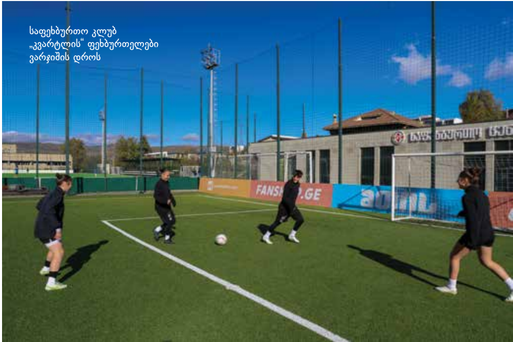
საფეხბურთო კლუბი „კვარტლის“ ფეხბურთელები ვარჯიშის დროს

მავარჯიშებდა. თავადაც ძალიან მომწონდა და მინდოდა. მშობლები დიდად კმაყოფილები არ იყვნენ, მაგრამ მე და ბაბუ სულ ვიმარჯვებდით“, – ჰყვება ის.