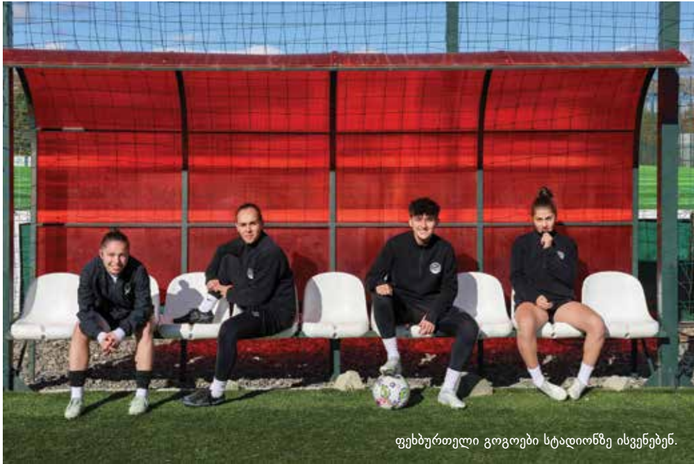
ფეხბურთელი გოგოები სტადიონზე ისვენებენ.