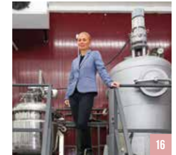
ინოვაციური სოფლის მეურნეობები

წინამდებარე პუბლიკაციის შინაარსი და მასში გამოთქმული მოსაზრებები შესაძლოა, არ გამოხატავდეს გაეროს ქალთა ორგანიზაციის, გაერთიანებული ერების ორგანიზაციის, მისი რომელიმე წევრი ორგანიზაციის, ან ნორვეგიის სააგენტოს განვითარების თანამშრომლობისთვის ოფიციალურ პოზიციას.